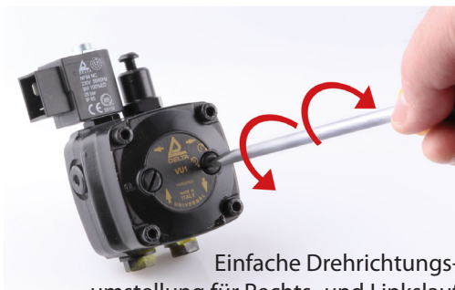
Einfache Drehrichtungs-umstellung für Rechts- und Linkslauf